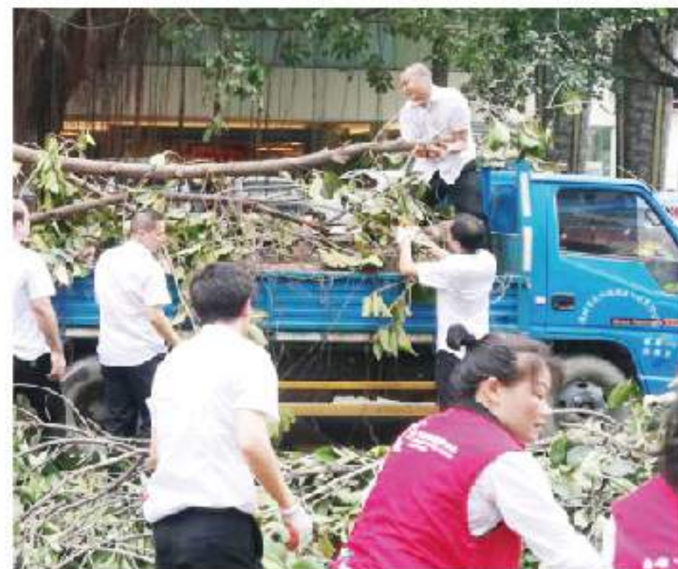
台风过后扶树、清扫