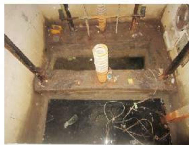
图1：遭遇台风后进水的电梯底坑

虽然台风、雷电等极端气候无法避免，但只要结合不同建筑物的自身特点，制定好紧急预案，把握好事前、事中、事后各个环节，就可以将极端气候给电梯带来的损失降到最低。