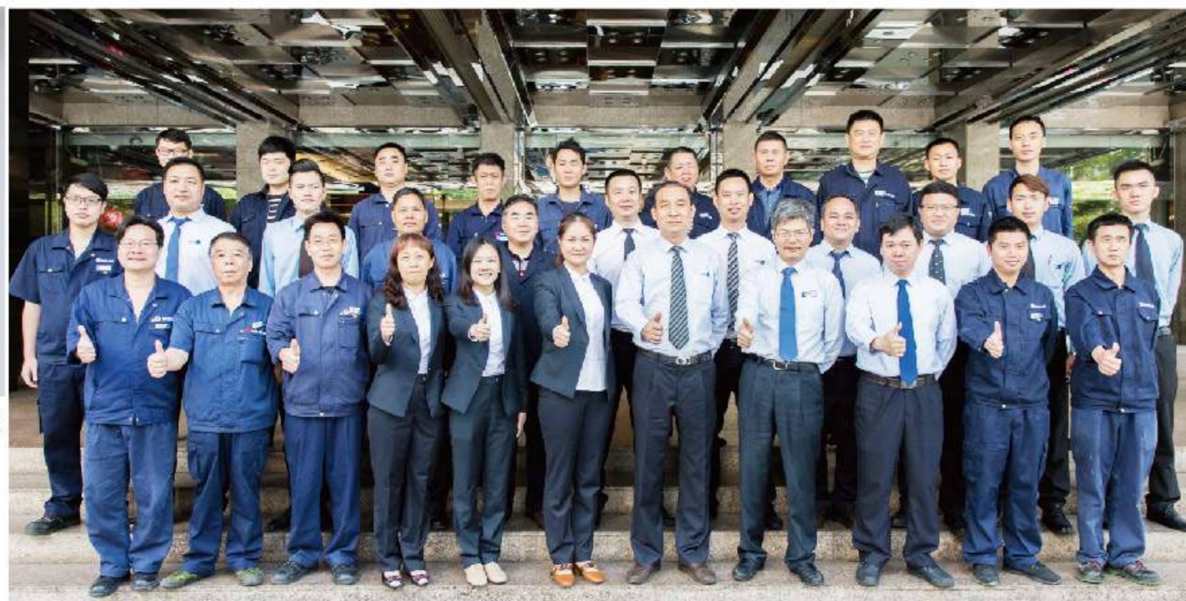
国贸大厦管理层集体合影