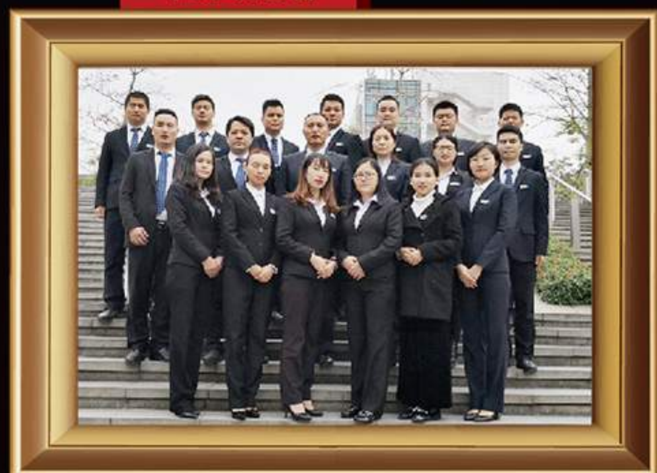
2018年度 安全生产先进单位 最佳收费奖