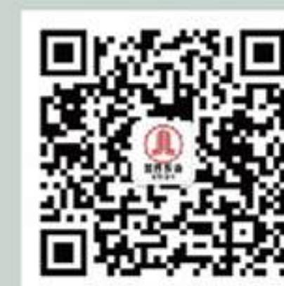
国贸物业微信公众号

活动当天我们提前做好安排, 准备好各种包水饺所需食材、布置活动现场。住户们也参与其中, 捋起衣袖和面、擀皮、拌馅, 有模有样, 场面非常活跃。包饺子的过程更是精彩, 虽然包出来的饺子形状各异但充满着温情, 人群中不时传出阵阵笑声, 气氛快乐而温馨。当一碗碗热气腾腾的饺子煮好, 饺子香气扑鼻而来, 将冬日的寒冷一扫而尽, 缓解了他们的思乡之情, 回到宿舍也有“家”的温情。