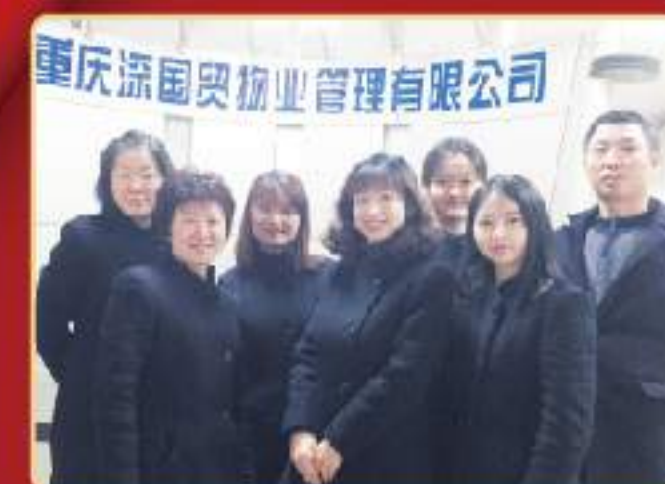
获奖者：重庆深国贸公司财务部