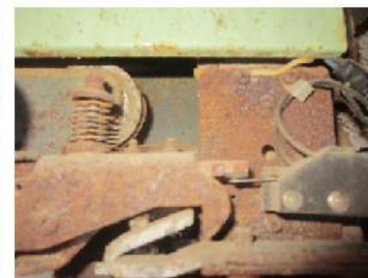
图2：雨水浸泡后的电梯层门门锁