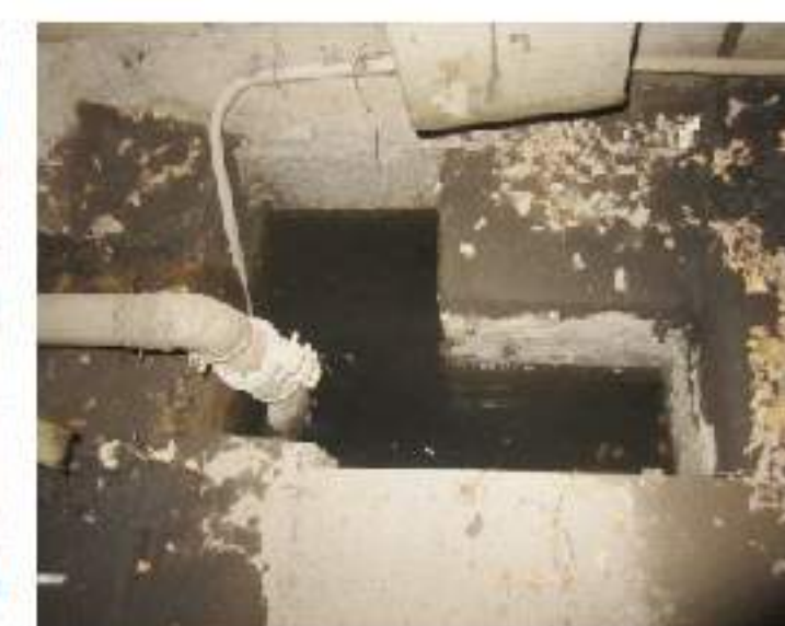
图4：与污水井连通的电梯底坑