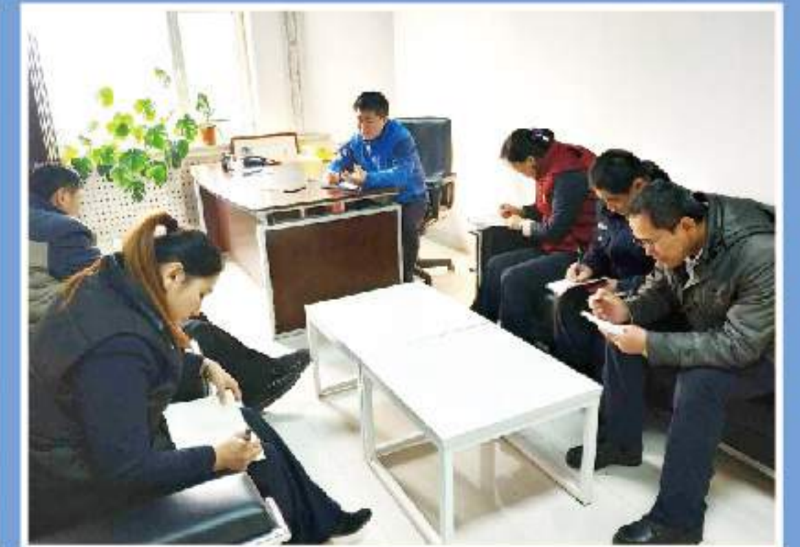
现场考察，制定方案