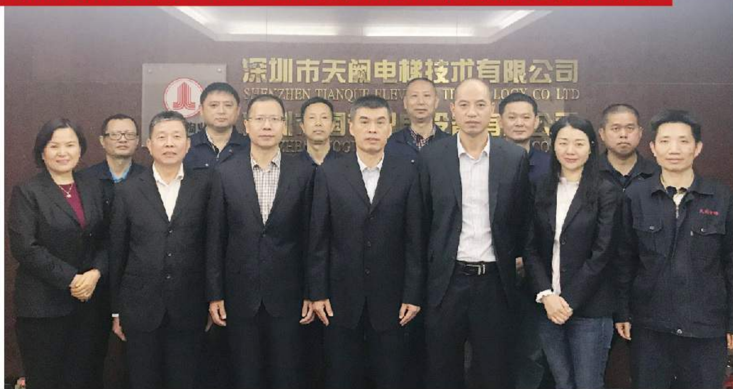
▲ 深圳国贸物业天阙电梯有限公司集体合影