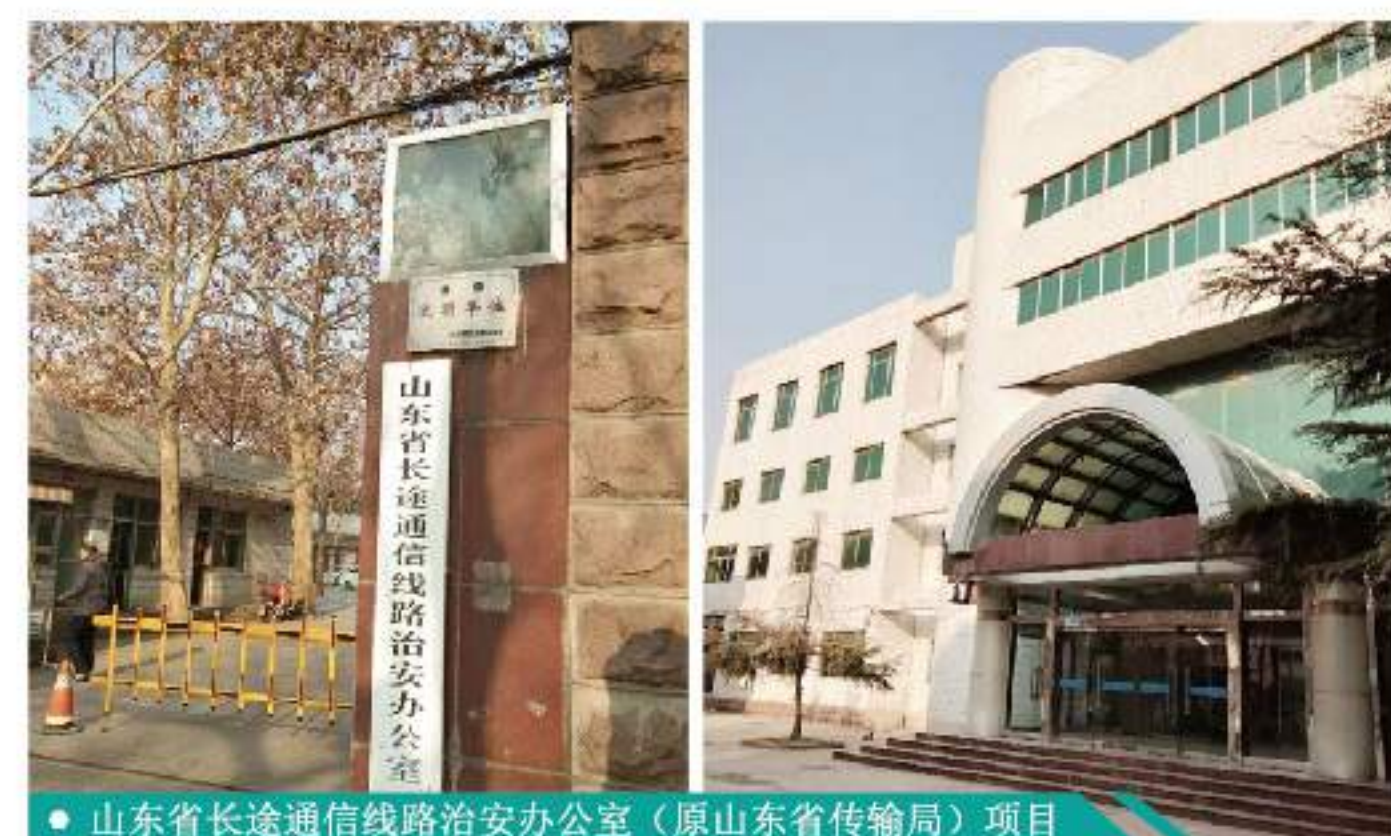
● 山东省长途通信线路治安办公室（原山东省传输局）项目

2019年1月1日，山东深国贸公司成功中标山东省长途通信线路治安办公室（原山东省传输局）项目，打响2019年开年第一枪，为公司2019年的蓬勃发展赢得开门红。