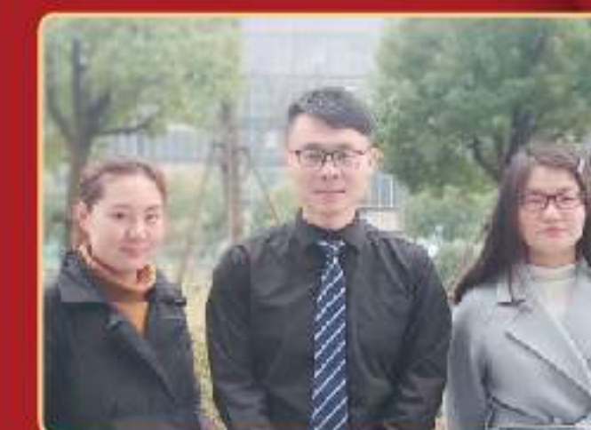
获奖者：杭州分公司市场部