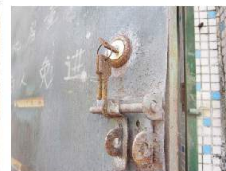
图3：锈蚀的电梯机房门及门锁