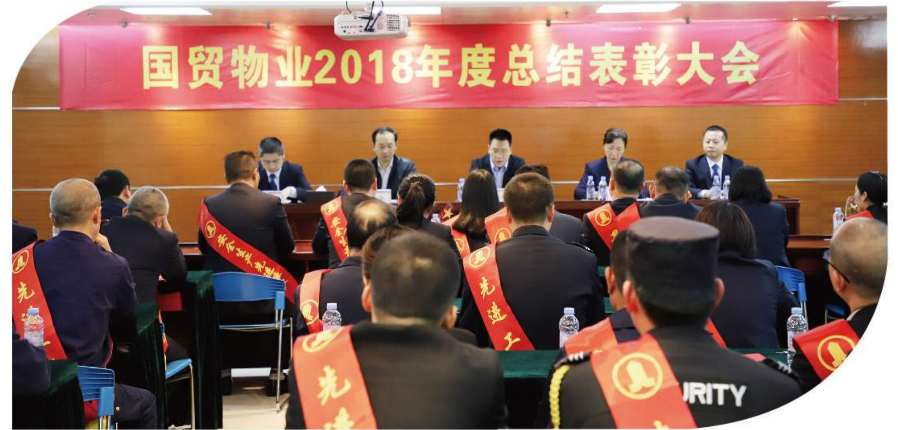
▲ 国贸物业2018年度总结表彰大会现场

告别2018，我们将站在新的起点上；展望2019，我们将用奋斗塑造更加辉煌的未来！国贸物业公司一年一度的总结表彰大会都是开年最振奋人心，最激情澎湃的一件大事，总结过去，展望未来，感受国贸物业大家庭的浓浓暖意。